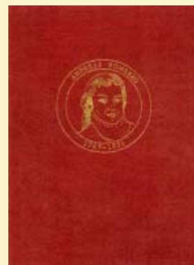
Einband der Ganzleinenbände Cover of the clothbound volumes